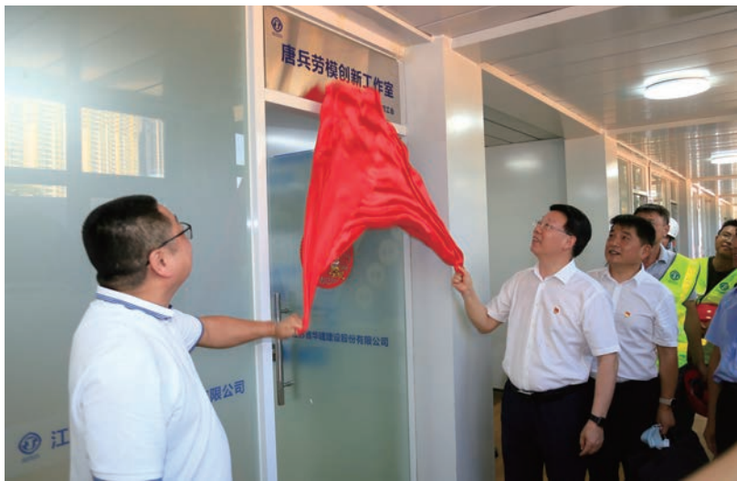
劳模创新工作室揭牌

走进项目现场，首先映入眼帘的是党建文化墙、党建长廊、党建橱窗，长达 50 米的党建长廊，清晰地展现了中国共产党的百年奋斗历史、党的二十