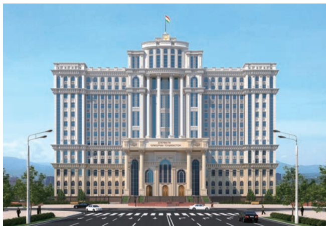
援塔吉克斯坦政府办公大楼

2020年，江都建设领导层经过反复酝酿先后打出三记组合拳。一是进行了重大人事调整。一年内先后撤去或调动7个区域公司一把手经理，调整5个区域公司财务负责人，这一举措一时间也曾在江都掀起不小的震动。二是加强内控体系建设。深度结合公司高质量发展实际和市场需求，进一步强化各项基础管理，继续深化依法诚信经营、加强财税制度执行、强化法律事务管理等方面工作，通过规范化管理来预防各类不可预知的风险。2021年对历年公司制订的各项规章制度进行收集整理，并进一步加以梳理和完善，出台《企业管理制度汇编》，并组织上到公司高管、部门经理、区域公司经理，下到项目承包人和项目经理等人员的分层逐级培训和宣贯，实现制度体系化和连续性，筑牢了风险防范的根基。三是建立