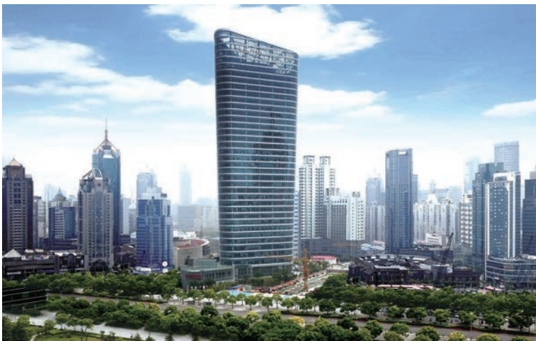
中建八局总部办公楼

文化自信是更基础、更广泛、更深厚的自信，是更基本、更深沉、更持久的力量。六十多年薪火相传，三十多年辉煌发展，中建八局始终坚持党的领导，传承红色基因，用一座座精品工程，一项项社会担当，铸就了“军魂匠心、家国情怀、令行禁止、使命必达”的铁军文化。为赓续信仰，传承精神，凝聚力量，中建八局积极探索文化建设的有效途径和方法，不断提升文化软实力，使铁军文化成为代代相传的精神之火、思想根脉和文化基因。