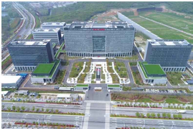
仙林新所区建设项目A地块土建安装工程 施工总承包A1及地下室(国优)

很多人说，这是一场针对所有建筑企业的大危机。我不反对，但也不认同。危机分两种，一种是客观必然的，一种是主观人为的。而这次所谓的危机，笔者认为，主观大于客观。