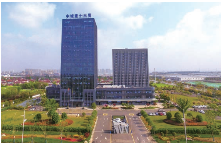
中城建第十三工程局总部大楼(国优)

基于此，2020年，住房和城乡建设部会同12部门，在深入调查研究、广泛征求意见、认真总结经验的基础上，联合印发《关于推动智能建造与建筑工业化协同发展的指导意见》（以下简称《指导意见》）。《指导意见》明确了推动智能建造与建筑工业化协同发展的指导思想、基本原则、发展目标、重点任务和保障措施，提出到2035年，“中国建造”核心竞争力