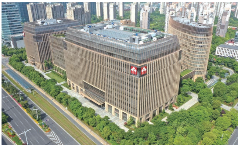
华泰证券广场工程1号楼及1号连廊(国优)

中华民族伟大复兴战略全局和世界百年未有之大变局的高度，统筹国内国际两个大局、发展安全两件大事，充分发挥海量数据和丰富应用场景优势，促进数字技术和实体经济深度融合，赋能传统产业转型升级，催生新产业新业态新模式，不断做强做优做大我国数字经济。立足新发展阶段，发展智能建造是住房和城乡建设领域贯彻落实习近平总书记关于数字化发展重要指示精神的必然要求，对推动建筑业高质量发展具有重要意义。