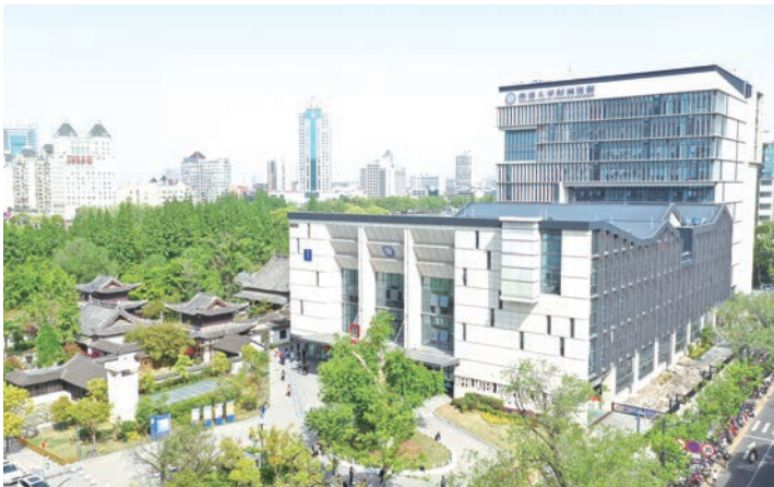
南通大学附属医院新建门诊楼(国优)

对于经营企业，笔者的理念是走稳步、不停步，不走弯路、回头路。至于企业的经营思路和管理模式，笔者始终认为，适合就好，管用就行。盲目地套用别的企业的理念和模式，只能是亦步亦趋，甚至可能“水土不服”。