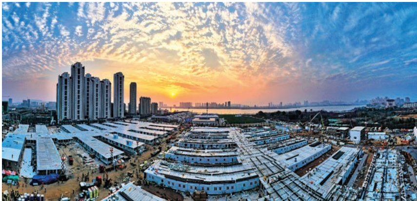
中建八局火速驰援雷神山医院项目建设

深化党建理念、人才理念、安全理念等8项践行理念的贯彻落实，修订各业务系统管理理念，形成系统文化管理制度，将有形的制度和无形的习惯融汇为