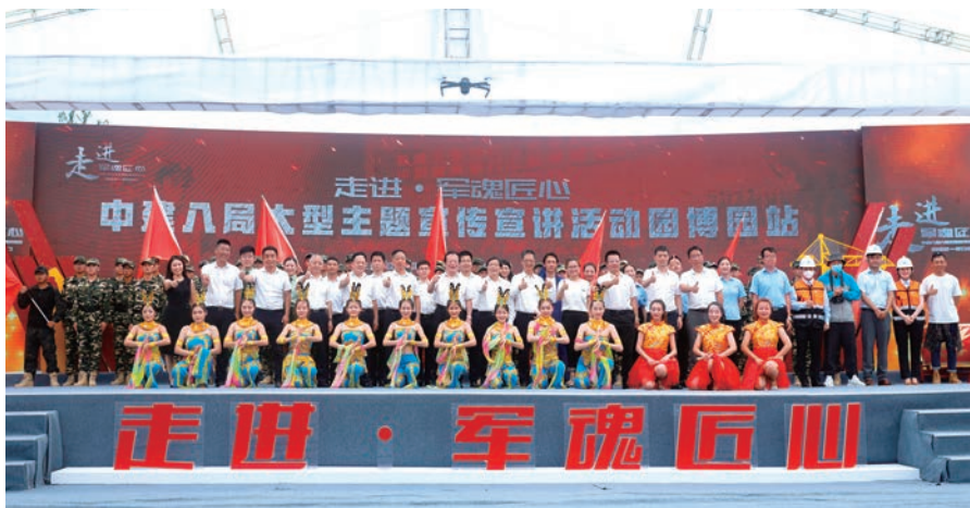
“走进·军魂匠心”大型主题宣传宣讲活动讲述铁军故事,传承铁军精神

始终注重发挥项目文化的引领作用,培育项目精神,确保企业核心价值理念在项目落地。制定《一二三四五 共建好项目》项目党群工作指导手册,大力开展“建证力量·红色基石”“建证匠心·红色先锋”党建品牌创建,深入开展劳动竞赛、三号联创,推广区域党建联建、农民工工作站,打造“学习型、创新型、和谐型、廉洁型、效益型”项目,使项目成为效益的源头、管理的样板、形象的窗口、精神的园地、人才的摇篮。深入开展项目准军事化管理,按照“行动军事化、工作标准化、作风严谨化、管理精细化”的要求,培养项目团队良好的行为习惯和作风纪律,把项目准军事化管理融入施工生产的各个环节,打造了一大批“齐刷刷、嗷嗷叫”的铁军团队,让“令行禁止、使命必达”的企业作风深入人心,树立了企业良好形象。