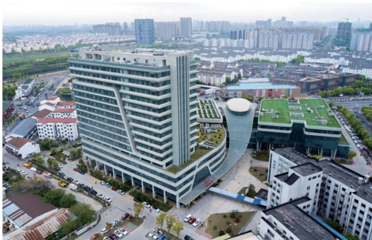
苏州大学附属第二医院高新区医院扩建医疗项目一期(国优)

鼓励民营建筑企业与实力强、技术先进的央企、国企搞混合所有制改革，实现多元投资、优势互补。同时通过深化内部经营、管理、人事等方面的改革，摒弃挂靠、承包等简单、粗放的经营管理机制，构建真正意义上的一个法人经营主体，将由一艘艘小舢板拼凑成的松散型联合舰队提档升级为一体化的