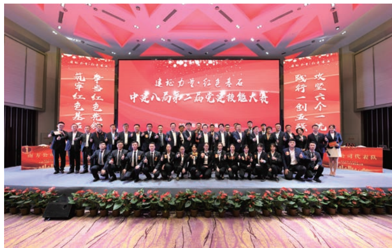
中建八局第二届党建技能大赛,促进党务干部技能提升

用铁军文化培养出来的八局人，在急难险重任务面前，勇于亮剑，敢于争先。大漠精神、高原精神、玉树援建精神、海外精神，演绎着一个个生动感人的铁军故事，薪火相传，生生不息！助力大国外交，承建北京 APEC、杭州 G20、厦门金砖、青岛上合、上海进博会等场馆建设，成为中国高端建造品质和形象的代表。履行央企责任，增进民生福祉，精准扶贫务实高效，抗击疫情挺身而出，决胜全面小康贡献力量，为大国筑基，为小家筑梦。