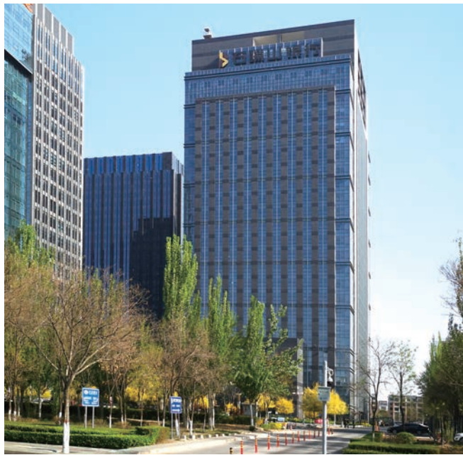
银川石嘴山银行大厦(鲁班奖)

创业维艰，奋斗以成。持续三年的疫情宣告结束，未来属于脚踏实地的实干者，属于毫不懈怠的创