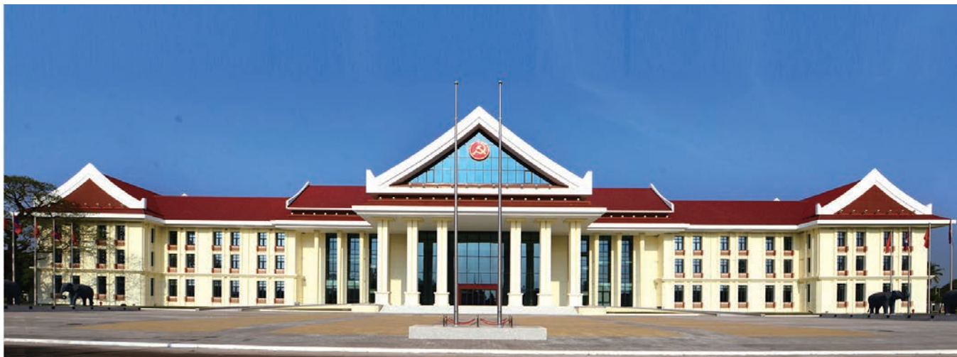
援老挝人民革命党中央办公楼(境外鲁班奖)

近年来，不仅国内工程质量稳步提升，援外项目也几乎每建必优。其中援建的总承包项目老挝人民革命党中央办公楼和坦桑尼亚达累斯萨拉姆大学中国图书馆项目先后荣获境外鲁班奖。工程质量和配套服务水平的提高，赢得了良好的口碑，为江都建设立足海外市场打下了良好的基础。2020年，在激烈的竞争中一举夺得援塔吉克斯坦政府办公大楼，工程总建筑面积45674平方米，造价7.58亿元人民币。该项目是我国重点对外援助项目，也是公司迄今为止承接的规模最大、造价最高的援外项目，具有特别重大的政治及外交意义。该项目被商务部国际经济合作事务局列为年度援外一号工程。