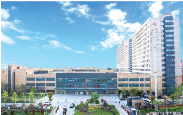
海门市人民医院新院急诊医技住院办公楼(国优)

履约能力较差。相当一部分建筑企业由于资金紧张、诚信意识淡薄等诸多原因，造成对外履约情况差，诉讼缠身。少数企业经常被法院列为失信被执行人，法定代表人经常被限制高消费。