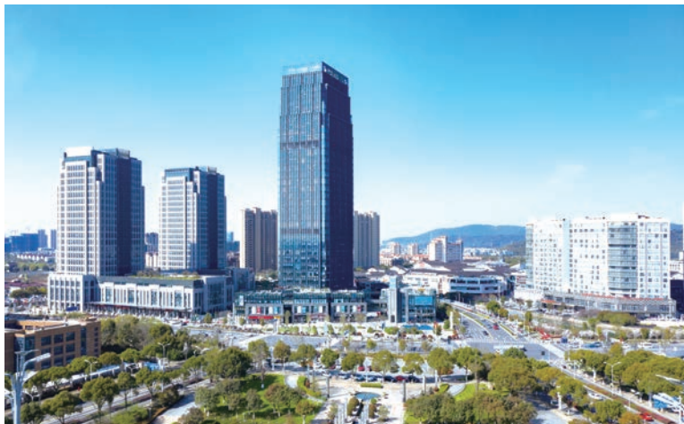
绿景·NEO(苏地2007-G-22号地块)项目(国优)

从传统建筑业向智能建造和建筑工业化跨越，实质是生产力的大幅提升。当前，发展智能建造，已成为建筑业突破发展瓶颈、增强核心竞争力、实现高质量发展的关键，已成为有效拉动内需的重要举措，成为顺应国际潮流、提升“中国建造”核心竞争力的有