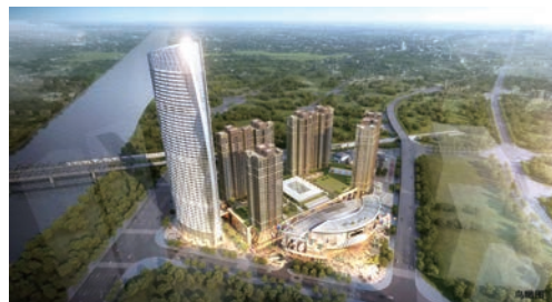
JIANGSU CONSTRUCTION INDUSTRY